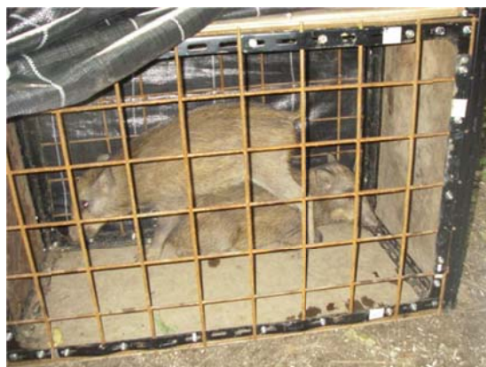
箱わなで捕獲されたイノシシ