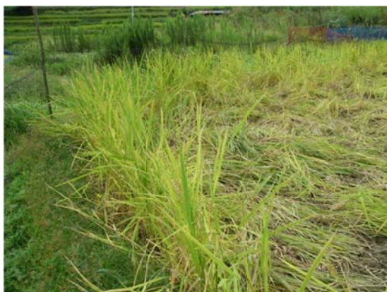
イノシシにより被害を受けた農地