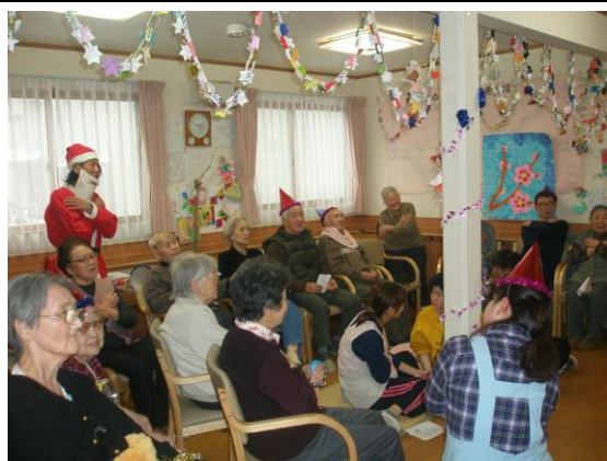
季節行事での利用者同士の交流