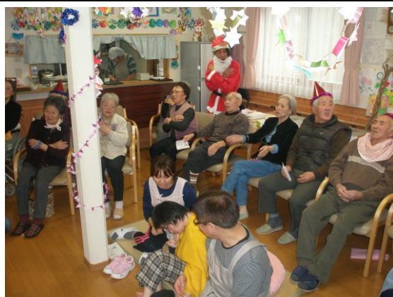
施設内でくつろいでいる様子