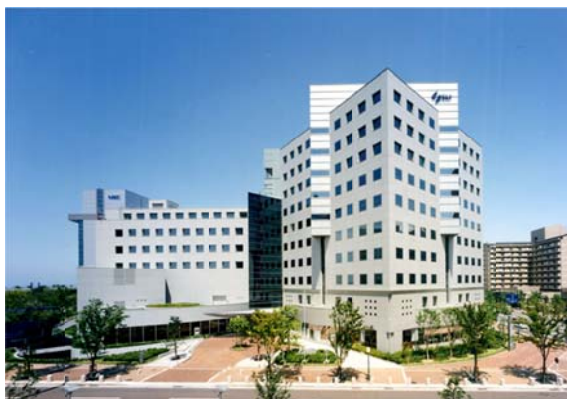
情報関連産業の集積地 福岡ソフトリサーチパーク