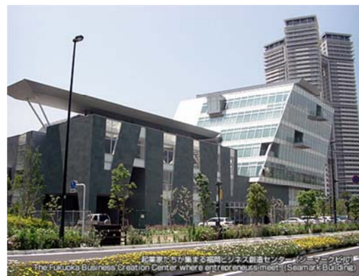
サイバー大学が入居する シーマークビル