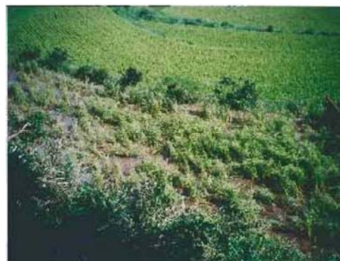
被害にあった水田の状況