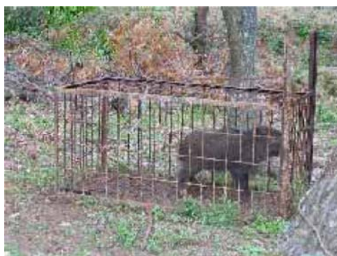
箱わなで捕獲したイノシシ