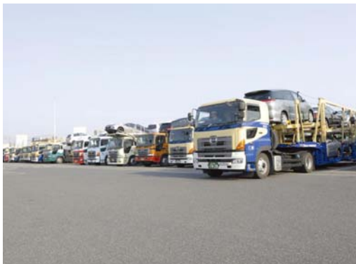
港や工場へ出発するトレーラ