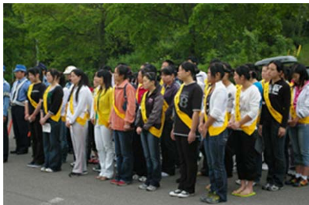
交通安全運動に地域と一体となって参加