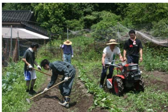
農業体験 ウィザス ナビ高校ふれあい農園