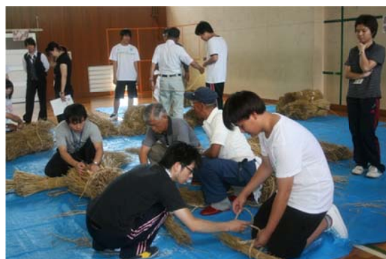
体験学習 三宅の万灯さん「わら松明」製作