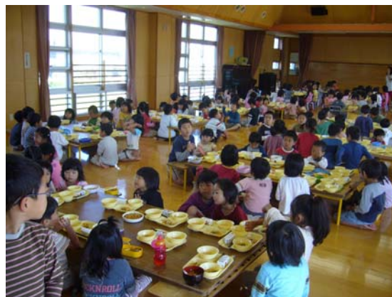
給食を楽しむ園児