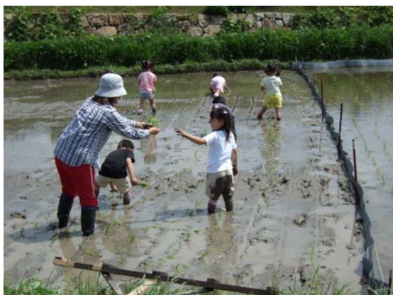
農業体験で田植えを行う園児