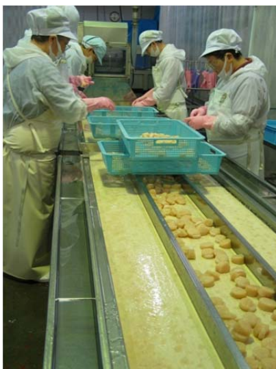
ホタテ貝柱選別の様子