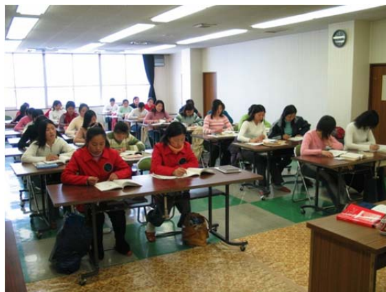
日本語講習会の様子