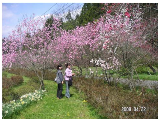
農家民宿私設庭園での春の花まつり