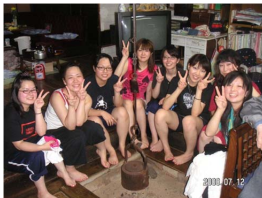
農家民宿の囲炉裏を囲んで