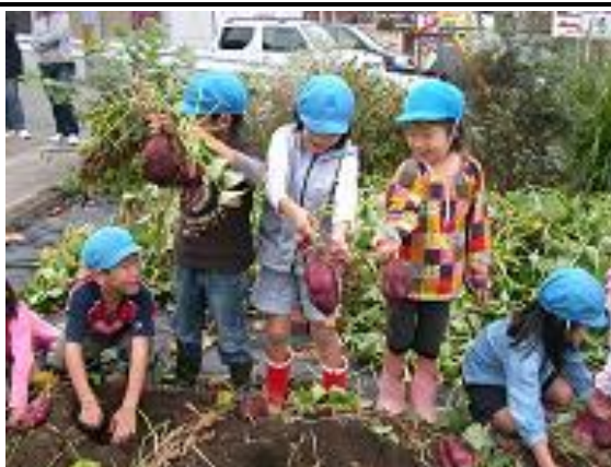
ワーイおおきなおいもができたよ