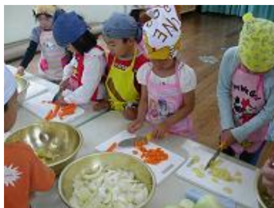
みんなでそだてたやさいでクッキング！