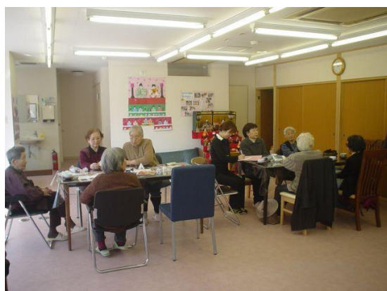
小規模多機能型居宅介護事業所の様子