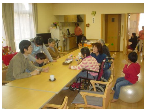
高齢者と障害児・者が交流する様子