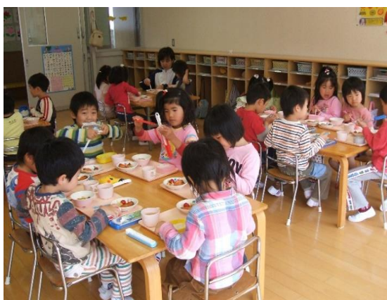
外部搬入された給食を食べる様子