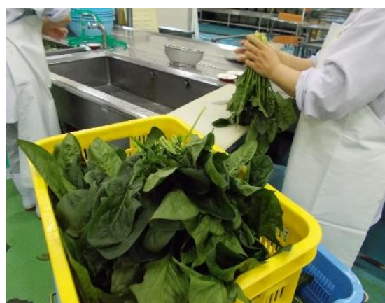
地場産のほうれん草