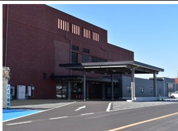
鳥取療育園外観写真