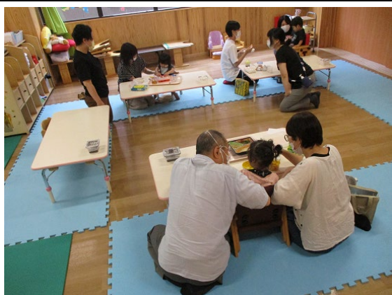
給食の提供を通じた子どもの健全育成 (食育)