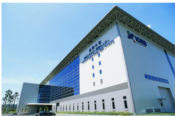
佐賀大学海洋エネルギー研究センター