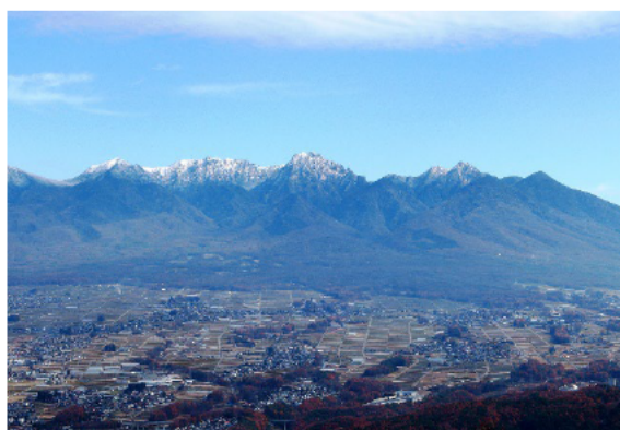
八ヶ岳西麓地域の田園風景