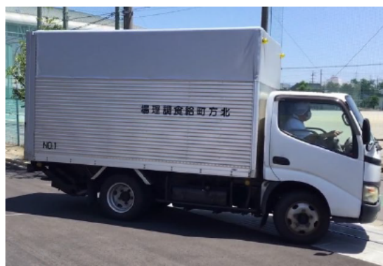
各施設に運搬する様子