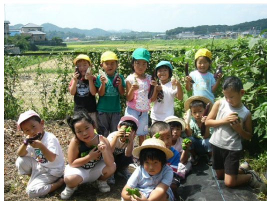
夏野菜の収穫の様子（食育）