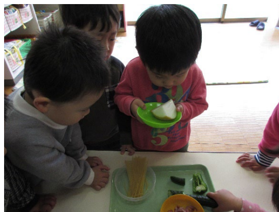
給食食材に触る食育活動