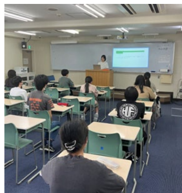
スクーリングの様子 (イメージ)