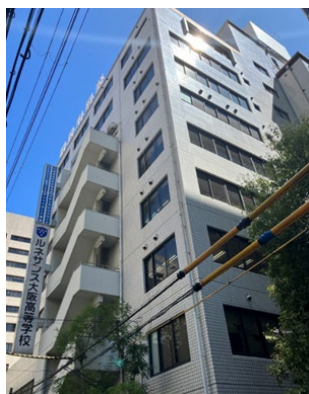
大阪校（学園ビル）の外観 「大阪駅」より徒歩5分