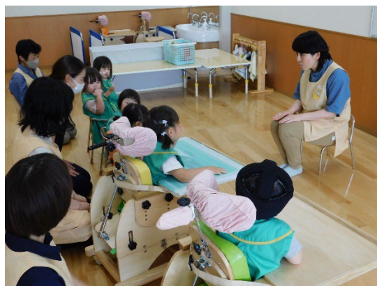
療育の様子（イメージ） （写真は公立の児童発達支援事業所）