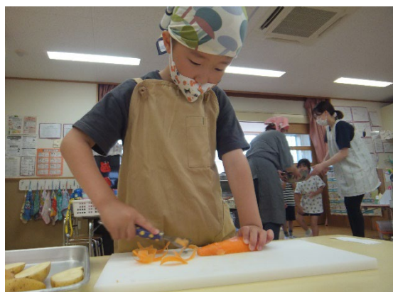
カレークッキング