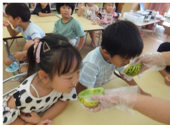
園庭で収穫したメロンの観察・試食