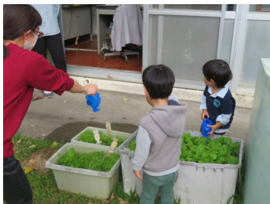
療育の様子（野菜の栽培）