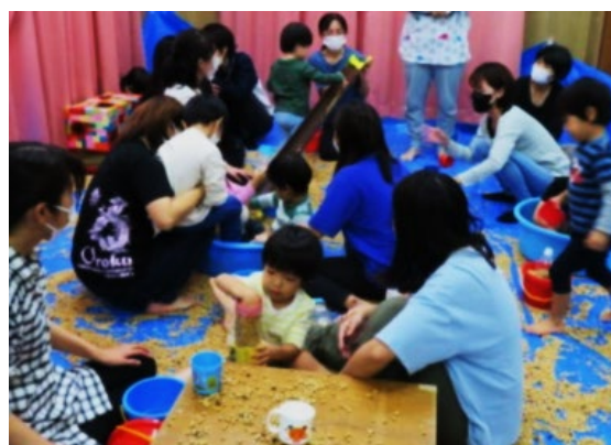
療育の様子（豆あそび）