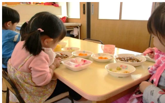
楽しい給食の時間