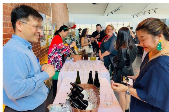
海外バイヤーとの商談会の様子