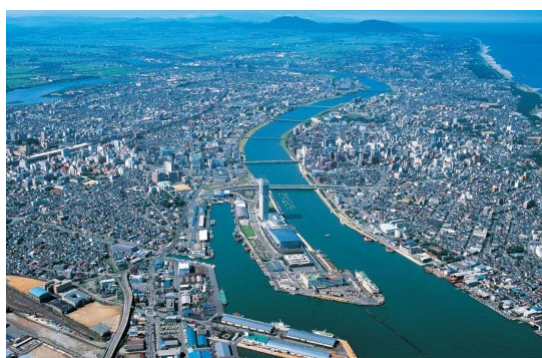
日本海拠点の活力を世界とつなぐ 創造交流都市・新潟