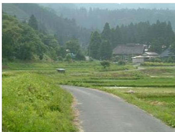
～川渡石ノ梅 風の道～