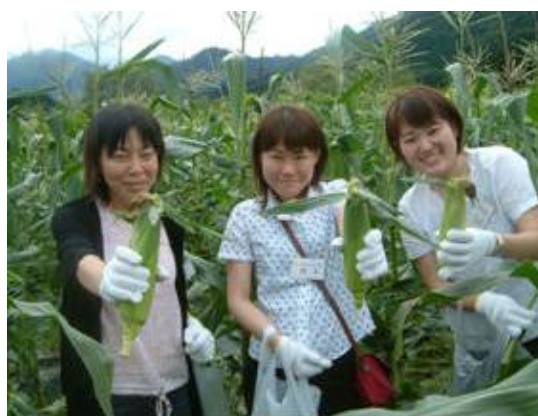
～鬼首 きらり 鬼楽里ふるさと体験～