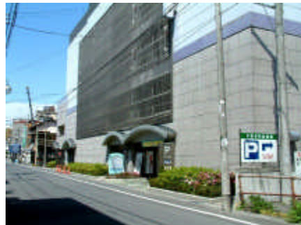
< 南本町通りからの南側全景 >