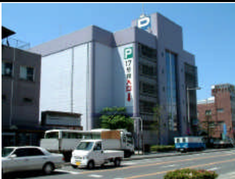
< 国道 17 号からの北側全景 >