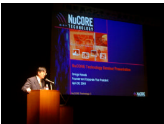
新横浜 IT クラスター交流会の様子 ( http://www.shin-yokohama.jp )