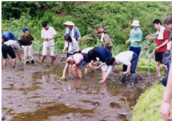
【国際色豊かな田植えの体験交流】