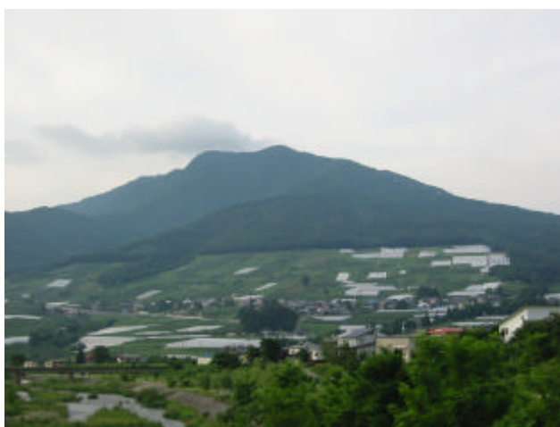
高社山麓に広がる農地