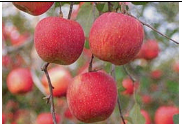
町の代表的農産物 りんご