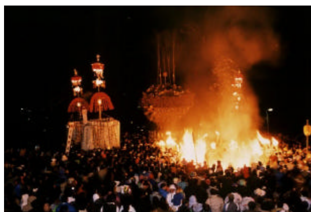
国指定重要無形民俗文化財「道祖神火祭り」