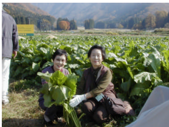
野沢菜の収穫体験