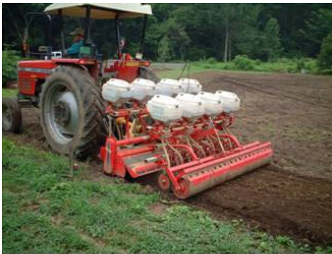
遊休農地でのそばの種まき作業