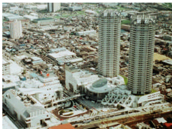
【泉大津駅東地区周辺】