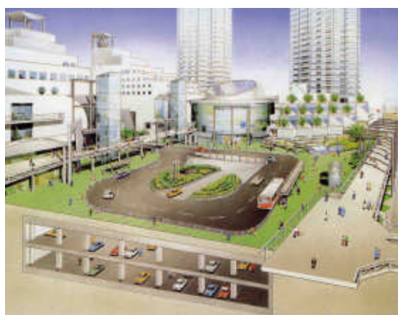
【泉大津市立駐車場概要図】