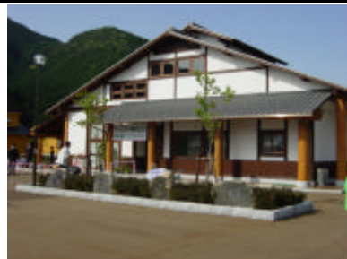
【青垣町の交流拠点施設】