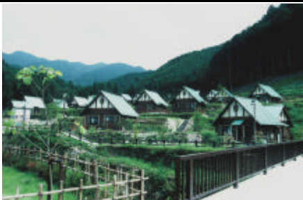
【八千代町の滞在型市民農園】