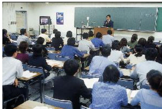
授業風景(イメージ写真)