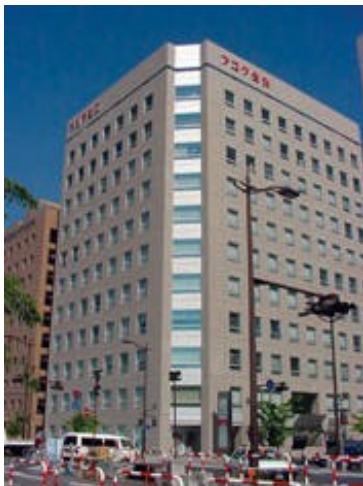
キャンパス開設予定地