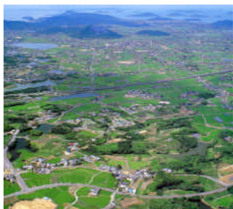
瀬戸のグリーントピア