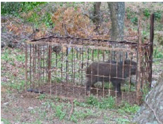
【箱わなで捕獲したイノシシ】