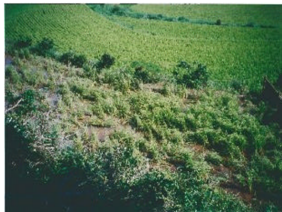
【被害にあった水田の状況】