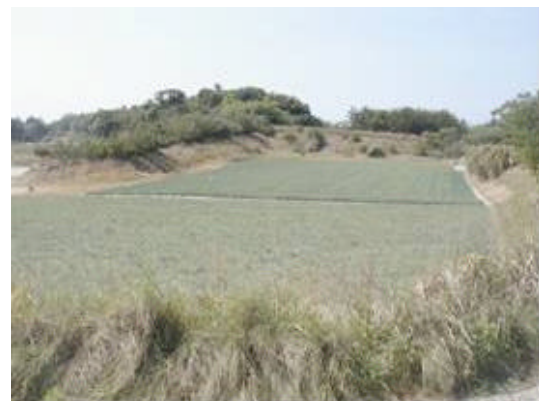
唐浜らっきょうほ場