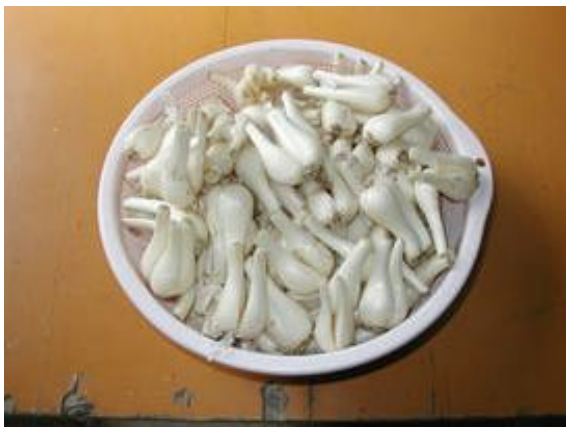
川内市特産物「唐浜らっきょう」