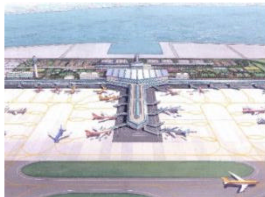
【中部国際空港イメージ図】