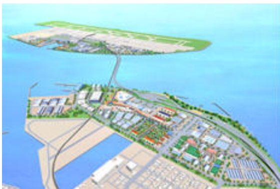
【中部臨空都市イメージ図】