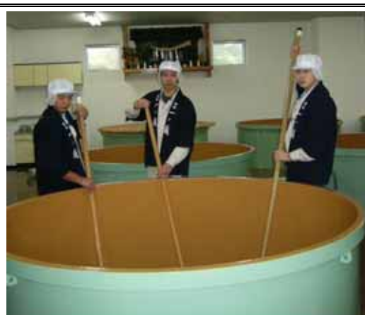
醸華邑構想の発信基地