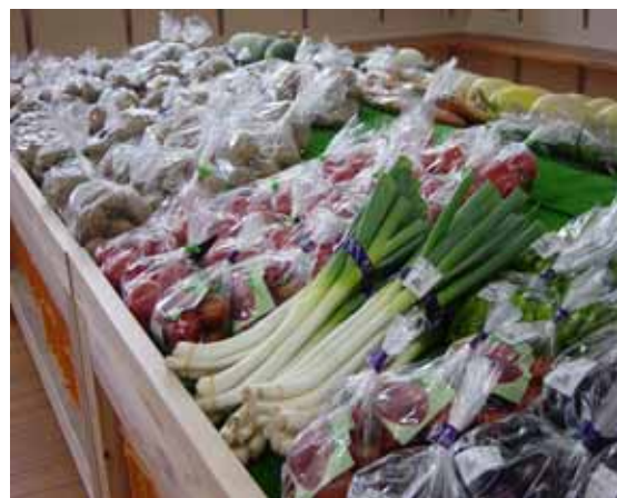
【ミネラル農産物直売コーナー（道の駅内）】