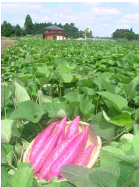
特産のサツマイモ「ベニコマチ」