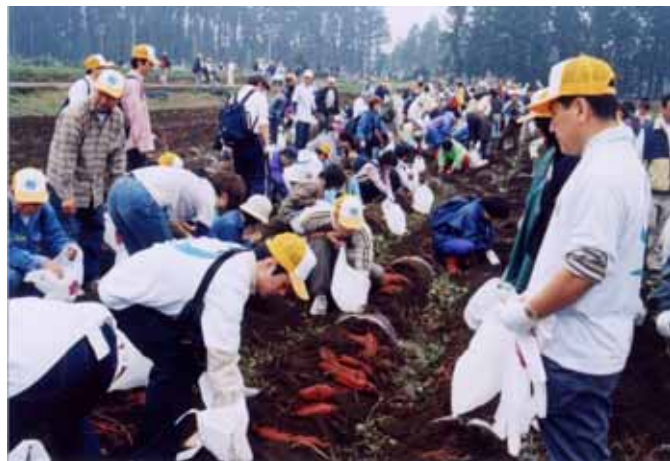
サツマイモの収穫体験