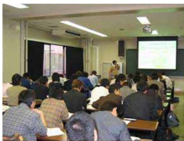
講座風景（イメージ写真）