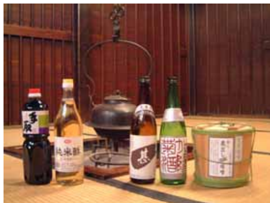
良質の水で育まれた醸造の品々