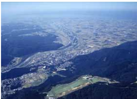
蕩々と流れる手取川