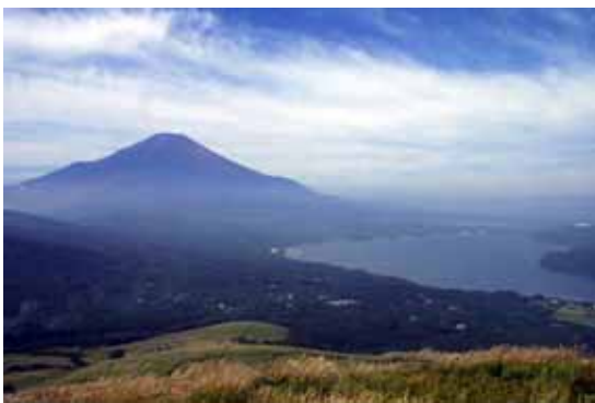
三国峠より見た山中湖村 雄大な富士山を背後に山中湖を臨む。