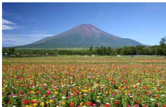
花の都公園地区 花を中心とした観光農業が展開されている。