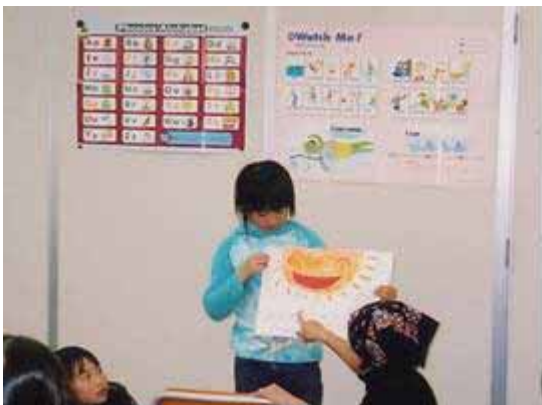
小学校の英語科授業 (フォニックス法による)