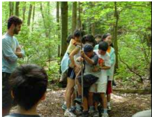
ネイティブスピーカーの 指導のもとでの野外活動