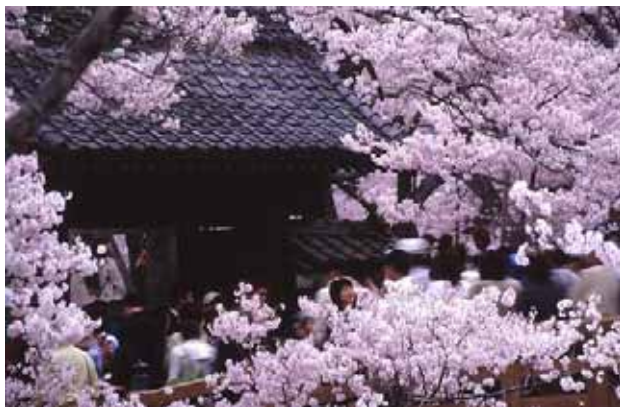
【観光客で賑わう高遠城址公園のさくら】