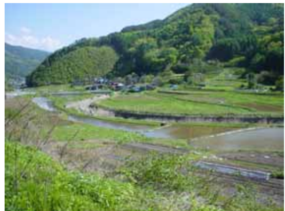
【緑溢れる田園風景】