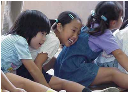
道徳 みんななかよし「コアラになろう」