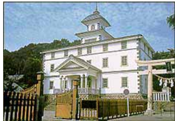
旧見付学校 現存する日本最古の木造洋風建築小学校