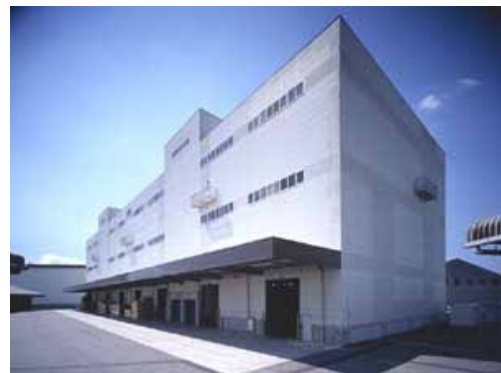
保税蔵置場（イメージ）