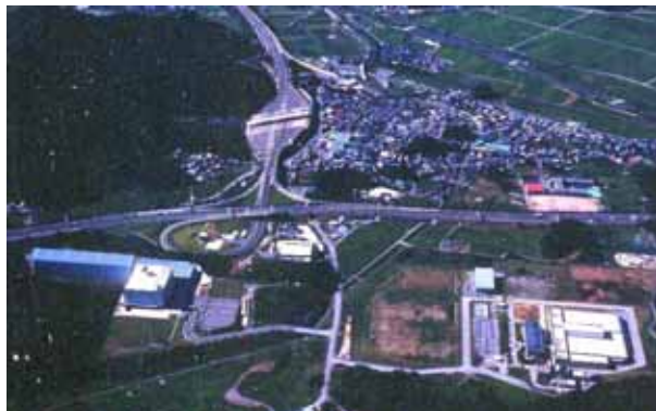
名神米原ジャンクションと工業団地