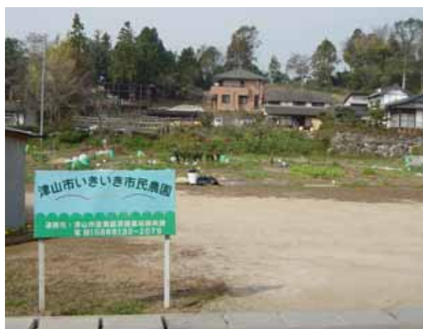
津山市いきいき市民農園