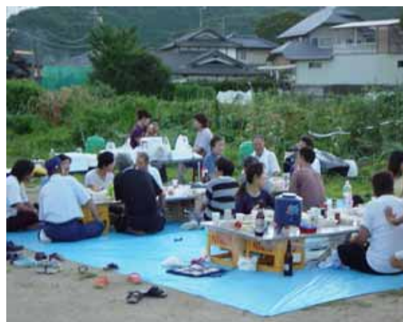
夏に行われた収穫祭